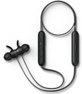
سماعات الأذن الداخلية من Philips بتقنية Bluetooth، Philips TAE1205