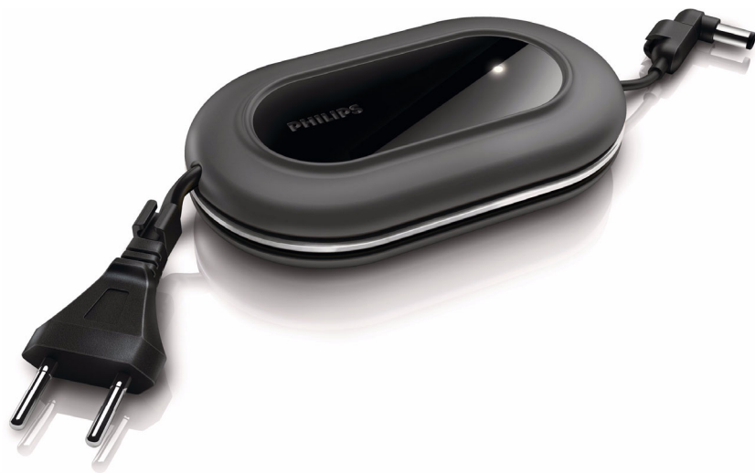
Philips Adaptateur secteur pour ordinateur portable