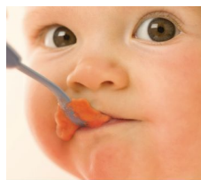
Recipe booklet Nutritious meals made easy