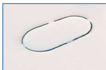
Steriliser with covered heating plate

Philips Avent has made the heating plate visible and easier to clean so you can ensure your steriliser is free from limescale at all times, for an optimum sterilisation cycle.