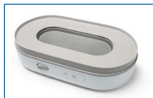
Naujas sterilizatoriaus dizainas su matoma kaitinimo plokšte