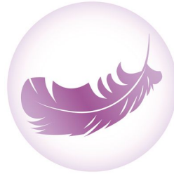
Lámina superior con sensación de seda y material transpirables y naturales. Probados dermatológicamente.