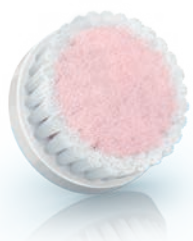
EXTRA SENSITIVE brush head (SC5993)

2 Special needs and care / Zvláštní potřeby a péče / Арнайы кажеттіктер және күту / Szczególne potrzeby kosmetyczne / Nevoi și îngrijire speciale / Особый уход и забота / Особливі потреби та догляд