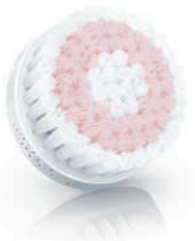
SENSITIVE brush head (SC5991)