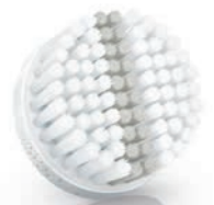
EXFOLIATION brush head (SC5992)