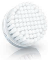
NORMAL brush head (SC5990)