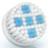
DEEP PORE Cleansing brush head (SC5996)

2 Special needs and care / Soins et besoins spécifiques / Necessità e cure speciali / Speciale behoeften en verzorging / Особый уход и забота