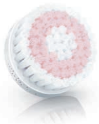
SENSITIVE brush head (SC5991)