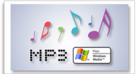
MP3- und WMA-Wiedergabe