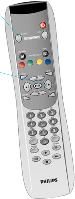
Mando a distancia de Streamium SL300i/SL400i

2 Seleccione Internet en el menú de la pantalla y seleccione Music (Música), Photos (Fotos), Movies (Películas) o Games (Juegos). Para pasar de una opción a otra utilice los botones de flecha del mando a distancia.