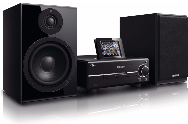
Philips Streamium Zestaw Hi-Fi z Wi-Fi