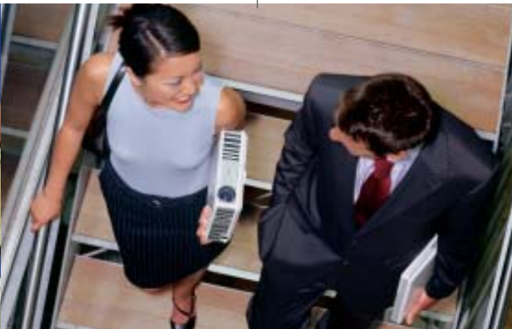
Ukáž a choď