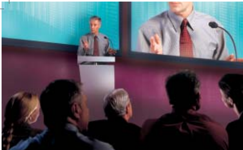
Veľký obraz so zmyslom pre detail