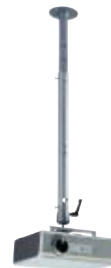
Konzola pre uchytenie na strop