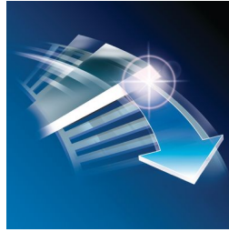
贴面剃须，欧洲制造