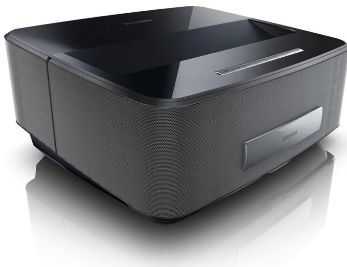
Imagen a lo grande

Disfruta del entretenimiento a lo grande: una imagen de entre 50 y 100 pulgadas con el proyector Screeneo a solo unos centímetros de la pared. Podrás moverlo por la casa fácilmente o instalar de forma sencilla un cine al aire libre en tu jardín. Además ofrece un sonido fantástico y Wi-Fi.