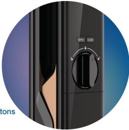
OPEN CLOSE Functional buttons

[เปิด]: ดับเบิลคลิกปุ่มภายในหนึ่งวินาทีจะปลดล็อคประตูได้ ซึ่งจะป้องกันไม่ให้เด็กและสัตว์เลี้ยงปลดล็อคโดยไม่ตั้งใจได้อย่างมีประสิทธิภาพ [ปิด]: คลิกที่ปุ่มหนึ่งครั้งสามารถล็อคประตูได้ การกดปุ่มค้างอาจเป็นการเปิดใช้งานการล็อคตาย คุณสามารถใช้รหัส PIN หลักหรือกุญแจกลไกเพื่อปลดการล็อคตาย การกดปุ่ม [เปิด] และ [ปิด] พร้อมกันจะทำให้สามารถเปิดหรือปิดใช้งานฟังก์ชันการปลดล็อคแบบอินดักทีฟได้