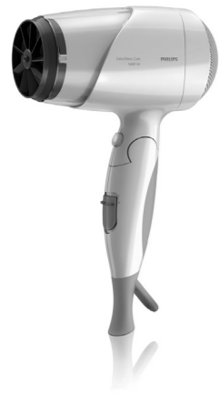
HP8200 HP8201 HP8202 HP8203