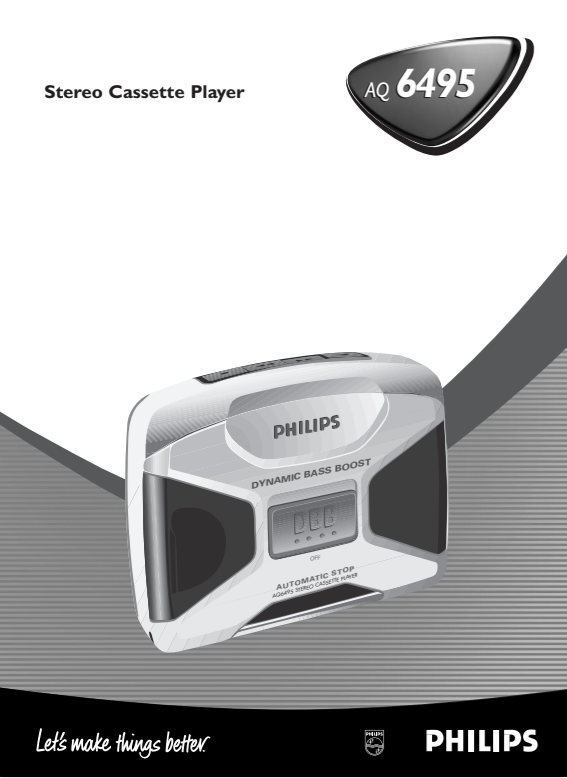
Philips AQ 6495 - Stereo Cassette player