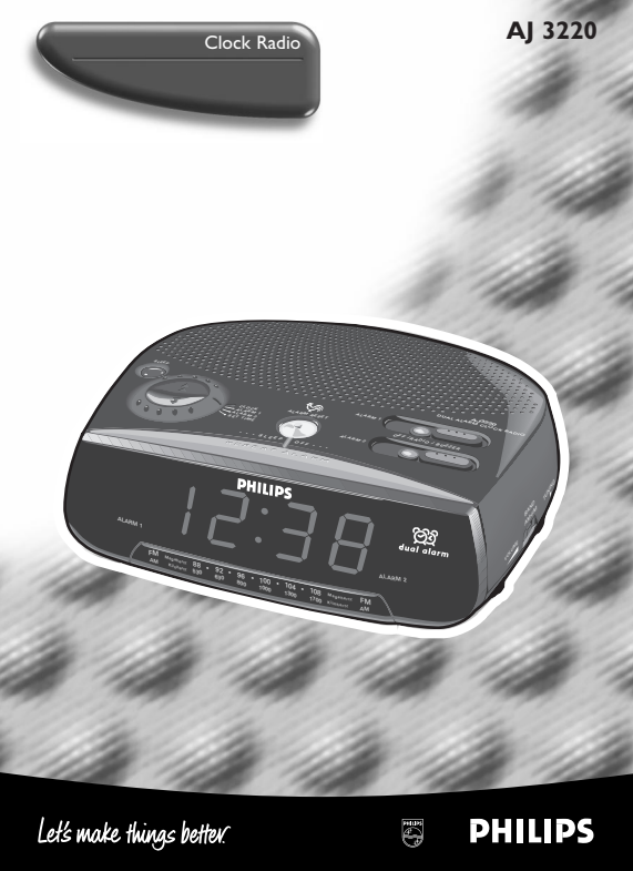
Let's make things better