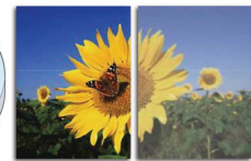
With SmartImage Without SmartImage

SmartImage — это уникальная современная технология Philips, позволяющая анализировать отображаемое содержимое на экране для оптимизации характеристик дисплея. Удобный для пользователя интерфейс предоставляет выбор различных режимов, таких как "Офис", "Фото", "Видео", "Игра", "Экономичный" и т. д. в соответствии с используемым приложением. В зависимости от выбранного режима SmartImage динамически оптимизирует контрастность, насыщенность цвета и резкость изображений и видео, обеспечивая исключительное качество изображения. В режиме "Экономичный" потребление энергии максимально снижено. В любое время можно легко установить необходимый режим нажатием одной кнопки.