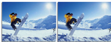
2ms GtG response time > 2ms GtG response time

SmartResponse 是飞利浦独有的驱动加速技术。启动时，它会根据特定应用程序要求自动调整响应时间，如游戏和电影需要更快的响应才可产生颤抖、时间迟滞和无重像影像